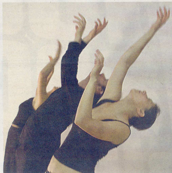
Una scena dello spettacolo di teatro-danza